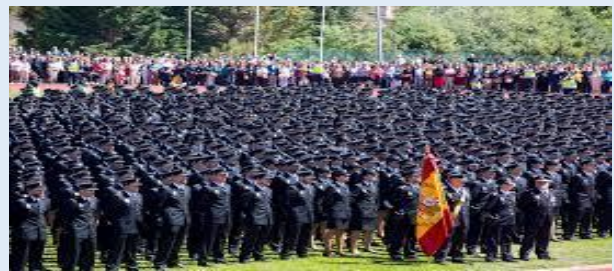
Acto de jura de nueva promoción

2023 respecto a 2011 se ha incrementado tan solo en 1.304 efectivos, lo que supone un aumento del 0,84%.