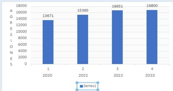
Datos del Ministerio del Interior

que actualmente se contemplan en el Código Penal, por lo que consideramos que quizás fuera conveniente plantearse una revisión de los mencionados artículos con medidas más ejemplares.