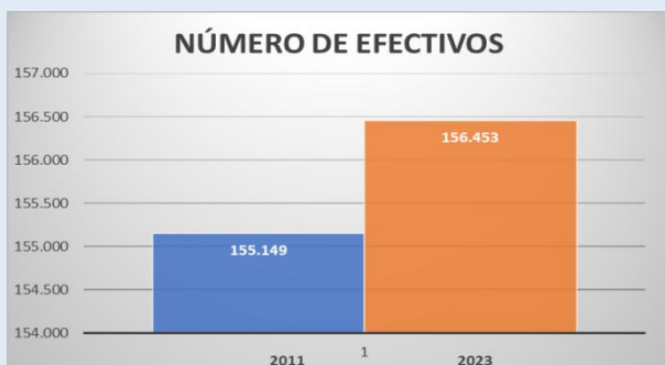
Datos Ministerio del Interior

Si bien es cierto que en los últimos años el Ministerio del Interior ha realizado un esfuerzo desde 2018, aumentando en 14.381 plazas netas en las Fuerzas y Cuerpos de Seguridad del estado, revirtiendo los 13.077 efectivos que se perdieron en el periodo 2012-2017, no lo es menos que, el numero actual de efectivos de 156.453 agentes entre Policía Nacional y Guardia Civil, (en el que se incluyen los alumnos recién salidos de las distintas academias y que se encuentran en la actualidad en periodo de prácticas y aquellos otros que se encuentran en la reserva en segunda actividad), es muy similar al número de efectivos que existía en el año 2011, cuya cifra era de 155.149 efectivos.